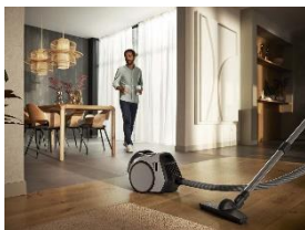
Foto 1: Der beutellose Bodenstaubsauger Boost CX1 Allergy von Miele ist aktueller Testsieger bei der Stiftung Warentest.