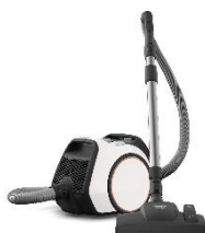
Foto 2: Kompaktes Design, starke Reinigungsleistung und hoher Bedienkomfort: Der beutellose Bodenstaubsauger Boost CX1 von Miele.