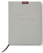
Foto 1: Creators of Quality. Seit 1899 – die faszinierende Miele Story ist jetzt als Buch erschienen; erhältlich im Miele Online-Shop und den Miele Experience Centern in Berlin, Düsseldorf und Gütersloh.