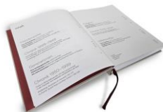
Foto 3: Ein Blick ins Inhaltsverzeichnis: Chronologisch erzählte Kapitel wechseln mit Reportagen, Interviews und Gastbeiträgen. Was das Unternehmen, die Marke und die Produkte so außergewöhnlich macht, wird aus vielen unterschiedlichen Perspektiven beleuchtet. Mit vielen, bislang unveröffentlichten, historischen Bildern. (Foto: Miele)

Foto 2: Außergewöhnliche Perspektive: Die Gründerurenkel und Geschäftsführer Markus Miele und Reinhard Zinkann auf den Dächern der Zentrale in Gütersloh. (Foto: Miele)