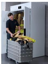
Foto 1: Mit einer Breite von 120 Zentimetern bietet der Trockenschrank „DC 120 WW“ Platz für Schutzanzüge, Handschuhe und andere Utensilien der persönlichen Schutzausrüstung.