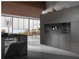
Foto 1: Zum 125-jährigen Jubiläum präsentiert Miele die grifflose ArtLine-Serie sowie Induktionskochfelder und eine Dunstabzugshaube im edlen Farbton Obsidianschwarz matt. Zusätzlich zur regulären Miele Garantie gibt es eine kostenfreie Garantieverlängerung von 125 Wochen.