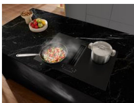
Foto 2: Das Induktionskochfeld mit integriertem Dunstabzug TwolnOne (KMDA 7876 FL) mit MattFinish ist edel in Haptik und Optik und dabei widerstandsfähig gegenüber Kratzern. Ein weiteres Plus der strukturierten Oberfläche ist, dass kaum noch Fingerabdrücke zu sehen sind. On Top in der 125 Gala Edition: eine kostenfreie Garantieverlängerung von 125 Wochen. (Foto: Miele)

Foto 1: Zum 125-jährigen Jubiläum präsentiert Miele die grifflose ArtLine-Serie sowie Induktionskochfelder und eine Dunstabzugshaube im edlen Farbton Obsidianschwarz matt. Zusätzlich zur regulären Miele Garantie gibt es eine kostenfreie Garantieverlängerung von 125 Wochen. (Foto: Miele)