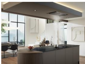
Foto 2: Für dunkler gestaltete Koch- und Wohnbereiche bietet Miele jetzt Deckengebläse im Farbton Mattschwarz.