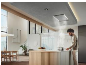
Foto 3: Streichen, folieren, lackieren – bei allen Modellen besteht die Möglichkeit, das Paneel individuell zu gestalten.