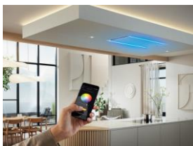
Foto 4: Auf Wunsch tauchen ausgewählte Modelle den Raum in ein stimmungsvolles, indirektes Licht (MyAmbientLight) – bequem über die Miele App stufenlos steuer- und dimmbar.