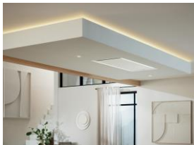
Foto 1: Harmonisch fügt sich das neue Deckengebläse im Farbton Mattweiß ins Küchenumfeld ein.