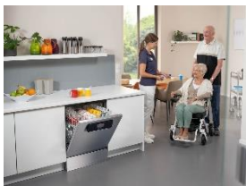
Foto 2: Hygienisch sauberes Geschirr für Senioreneinrichtungen – mit der Frischwasser-Spülmaschine PFD 401 U 125 Edition, die Miele bis 30. November mit einem Preisvorteil von 480 Euro gegenüber dem vergleichbaren Seriengerät anbietet. (Foto: Miele)

Foto 1: Hygienisch sauberes Geschirr für Büroküchen – mit der Frischwasser-Spülmaschine PFD 401 U 125 Edition, die Miele bis 30. November mit einem Preisvorteil von 480 Euro gegenüber dem vergleichbaren Seriengerät anbietet. (Foto: Miele)