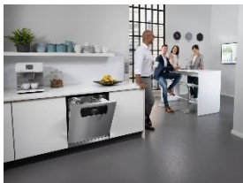
Foto 1: Hygienisch sauberes Geschirr für Büroküchen – mit der Frischwasser-Spülmaschine PFD 401 U 125 Edition, die Miele bis 30. November mit einem Preisvorteil von 480 Euro gegenüber dem vergleichbaren Seriengerät anbietet.