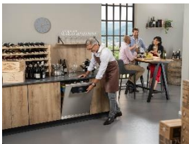
Foto 5: Hygienisch sauberes Geschirr für Weinhandlungen und Brauereien – mit der Frischwasser-Spülmaschine PFD 401 U 125 Edition, die Miele bis 30. November mit einem Preisvorteil von 480 Euro gegenüber dem vergleichbaren Seriengerät anbietet. (Foto: Miele)

Foto 4: Hygienisch sauberes Geschirr für Kindertagesstätten – mit der Frischwasser-Spülmaschine PFD 401 U 125 Edition, die Miele bis 30. November mit einem Preisvorteil von 480 Euro gegenüber dem vergleichbaren Seriengerät anbietet. (Foto: Miele)