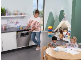
Foto 4: Hygienisch sauberes Geschirr für Kindertagesstätten – mit der Frischwasser-Spülmaschine PFD 401 U 125 Edition, die Miele bis 30. November mit einem Preisvorteil von 480 Euro gegenüber dem vergleichbaren Seriengerät anbietet.