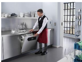
Foto 3: Hygienisch sauberes Geschirr für Hotels und Restaurants – mit der Frischwasser-Spülmaschine PFD 401 U 125 Edition, die Miele bis 30. November mit einem Preisvorteil von 480 Euro gegenüber dem vergleichbaren Seriengerät anbietet. (Foto: Miele)

Foto 2: Hygienisch sauberes Geschirr für Senioreneinrichtungen – mit der Frischwasser-Spülmaschine PFD 401 U 125 Edition, die Miele bis 30. November mit einem Preisvorteil von 480 Euro gegenüber dem vergleichbaren Seriengerät anbietet. (Foto: Miele)