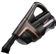
Foto 3: Die Nutzung der PowerUnit solo eignet sich beispielsweise zum Entfernen von Krümeln auf dem Tisch oder zum Absaugen von Sitzmöbeln. (Foto: Miele)

Foto 2: Mit der PowerUnit direkt unterhalb des Griffes im oberen Bereich kann man bequem auch unter Möbeln saugen. (Foto: Miele)