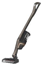
Foto 1: Der Triflex zeichnet sich durch seine hohe Flexibilität aus. Befindet sich die PowerUnit im unteren Bereich, ist der Schwerpunkt des Gerätes unten und es lassen sich auch große Flächen völlig mühelos saugen.