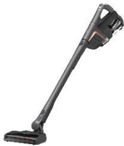
Foto 2: Mit der PowerUnit direkt unterhalb des Griffes im oberen Bereich kann man bequem auch unter Möbeln saugen. (Foto: Miele)

Foto 1: Der Triflex zeichnet sich durch seine hohe Flexibilität aus. Befindet sich die PowerUnit im unteren Bereich, ist der Schwerpunkt des Gerätes unten und es lassen sich auch große Flächen völlig mühelos saugen. (Foto: Miele)